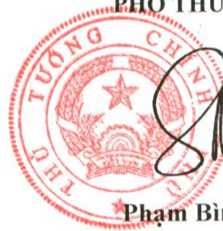
Phạm Bình Minh